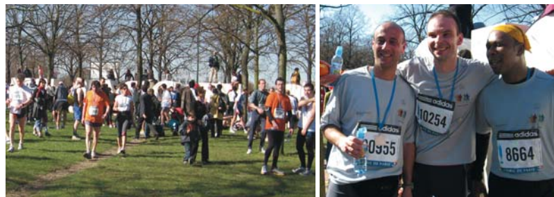
Le semi-marathon de Paris en 2007.

Comme chaque année, ils ont été plus de 50 coureurs, ce 2 mars 2008, à participer par équipe au semi-marathon de Paris (21,1 km) et à soutenir la JMH. Un grand merci à eux !